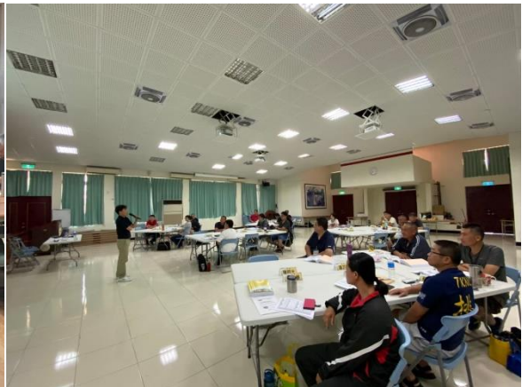
▲室內課程習得農業相關基礎知識