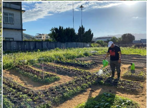
▲實作見習累積實際操作經驗